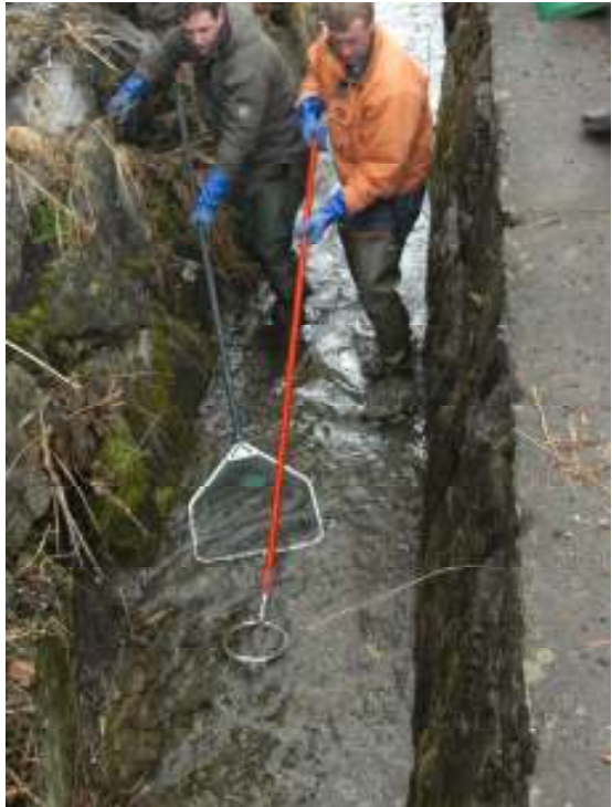
1c / 2 b / 3 c

Abfischen des „Moosgräbli“. Die einjährigen Forellen werden anschliessend in verschiedenen Gewässern ausgesetzt.