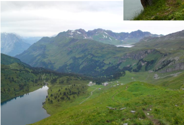
Eine etwas andere Sicht auf den Engstlensee (links)