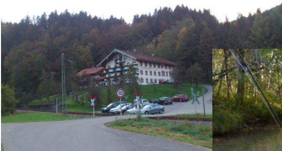
Hotel Forellenhof, Siegsdorf

Der Sepp sagt: "Wir sind ganz besonders stolz darauf, Ihnen die Fliegenfischerei an einem absoluten Traumwasser anbieten zu können!"